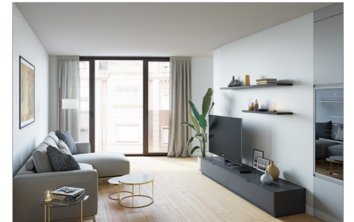
RENDER CUINA / ESTAR

(**) LES IMATGES I RENDERS SÓN UNA REPRESENTACIÓ ORIENTATIVA I PODEN VARIAR SEGONS LA TIPOLOGIA D'HABITATGE.