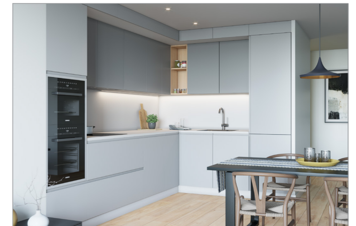
RENDER CUINA / ESTAR