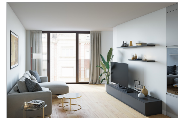
RENDER CUINA / ESTAR